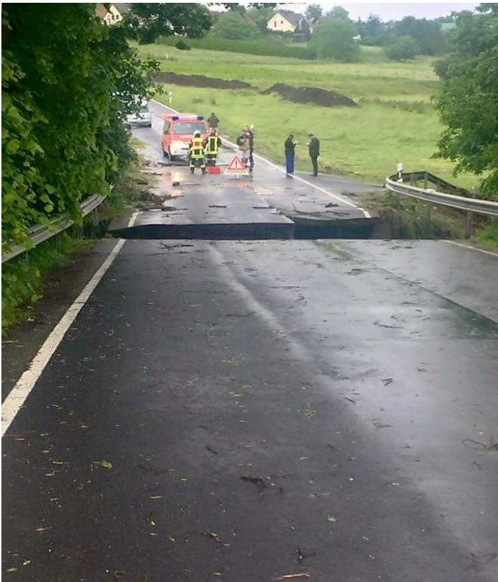
Birresdorf Brücke L79