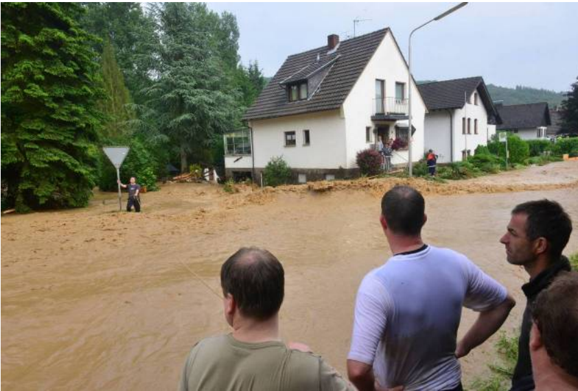
Niedernierendorf L80 Johannes-Häbler-Straße